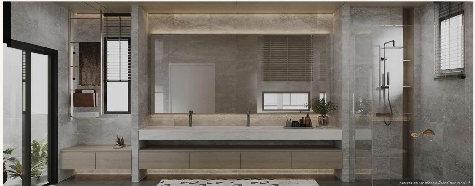
ภาพและบรรยากาศจำลองเพื่อการโฆษณาเท่านั้น*