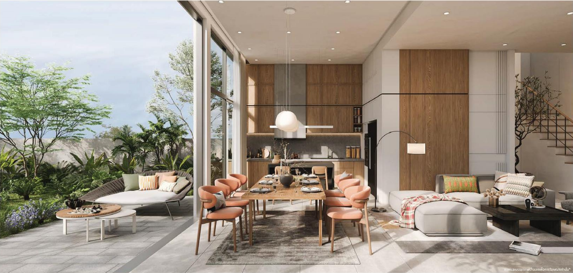
Living Room, Dining Area

ภาพและบรรยากาศจำลองเพื่อการโฆษณาเท่านั้น*