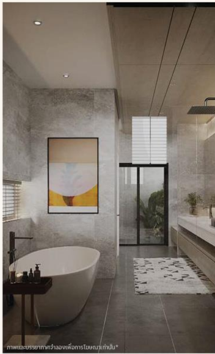
ภาพและบรรยากาศจำลองเพื่อการโฆษณาเท่านั้น*