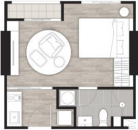
STUDIO 25.00 SQ.M.