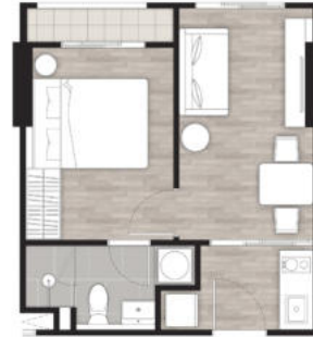
1 BEDROOM 29.00 SQ.M.