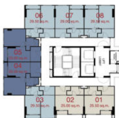
TOWER D : 2 nd - 8 th FLOOR PLAN