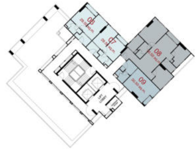
TOWER B : 21 st - 22 nd FLOOR PLAN