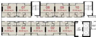
TOWER C : 3 rd - 23 rd FLOOR PLAN