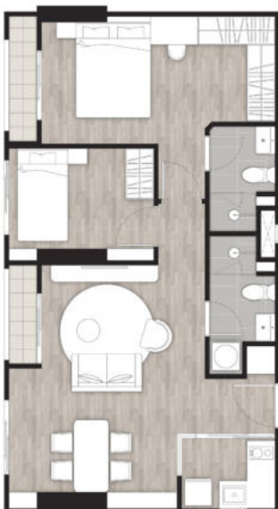
2 BEDROOMS 58.50 SQ.M.