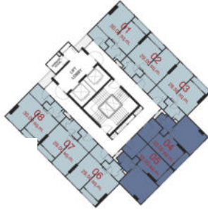
TOWER A : 10 th - 27 th FLOOR PLAN