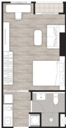
STUDIO 30.50 SQ.M.