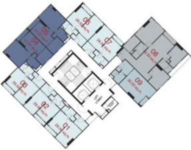
TOWER B : 2 nd - 12 th FLOOR PLAN