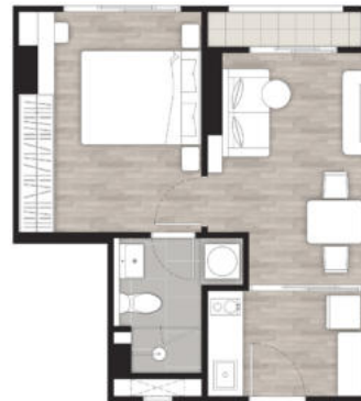
1 BEDROOM 33.00 SQ.M.