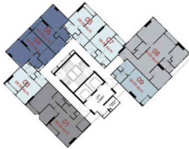
TOWER B : 13 th - 20 th FLOOR PLAN