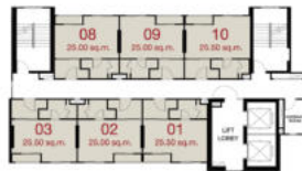
TOWER C : 24 th - 26 th FLOOR PLAN